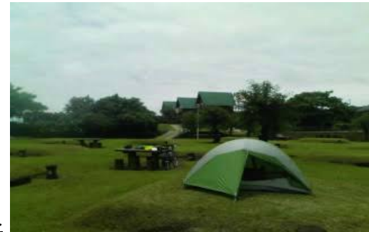
さんさん富江キャンプ

潮の満ち引きを利用した縄文時代から 行われる伝統漁法のことだよ！！ おびきよせた魚をみんなで網を使って 一カ所に追い込んで、手掴みで獲った 網で捕まえよう！ 夜はその魚でBBQだ♪